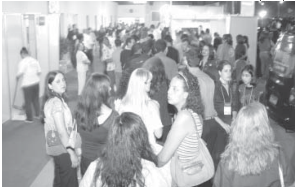
Organizadores apostam em novo crescimento de público e esperam aumento nas vendas