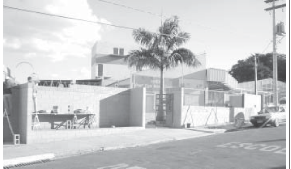
Mais desperdício: a escola é nova, entretanto uma reforma foi contratada