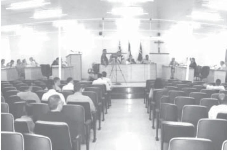
Vereadores devem discutir questões relacionadas às preocupações da comunidade