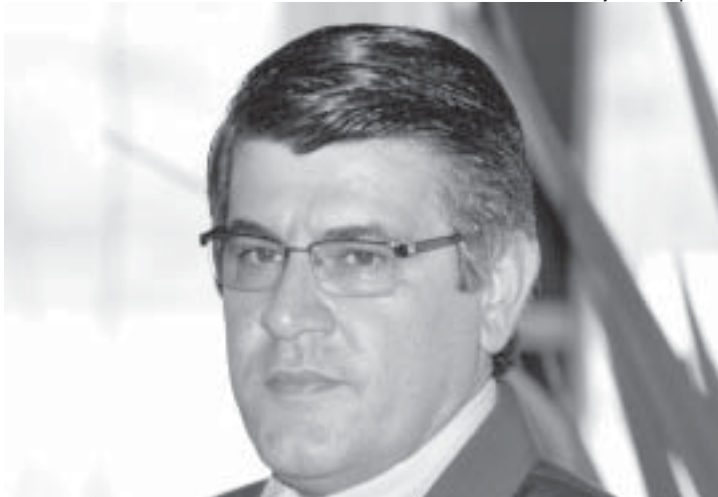
Odair: “precisamos profissionalizar o turismo de negócios”