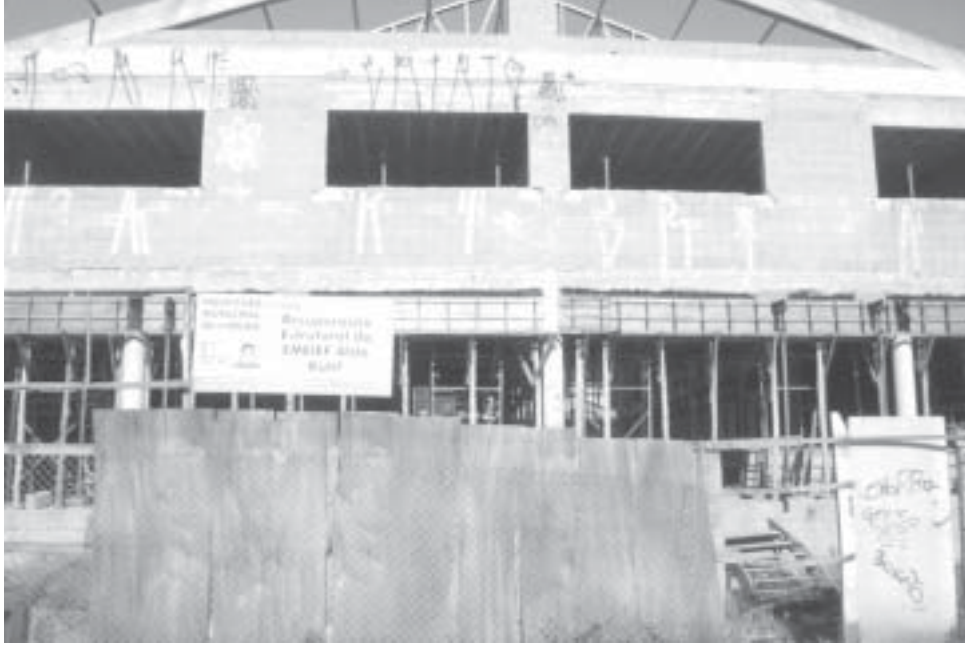
Dinheiro no lixo: com a ação do tempo o material está se deteriorando rápido