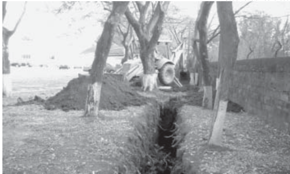
Obras na Câmara: por quê a licitação saiu pelo SAAE e não pela própria Câmara?