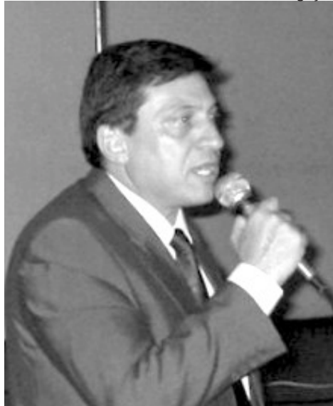
Pejón cobra a continuidade dos projetos