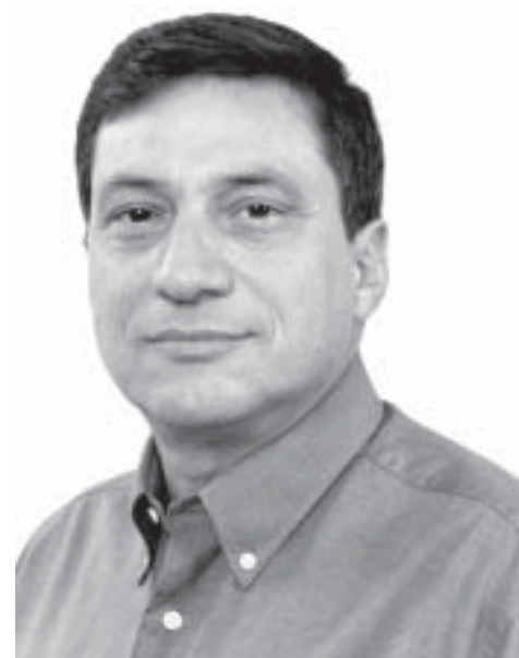
Pejon cobra continuidade de obras

Para ele, entretanto, há fatos positivos a serem analisados, como a retomada da pavimentação dos bairros Belinha Ometto e Ernesto Kühn; a recuperação das praças centrais, como também a continuidade do PNAFM (Programa Nacional de Apoio à Gestão Administrativa e Fiscal dos Municípios), aprovado jun-