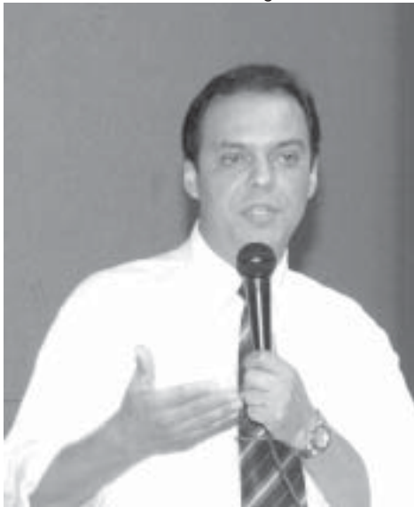
“O saldo é positivo, apesar dos problemas”