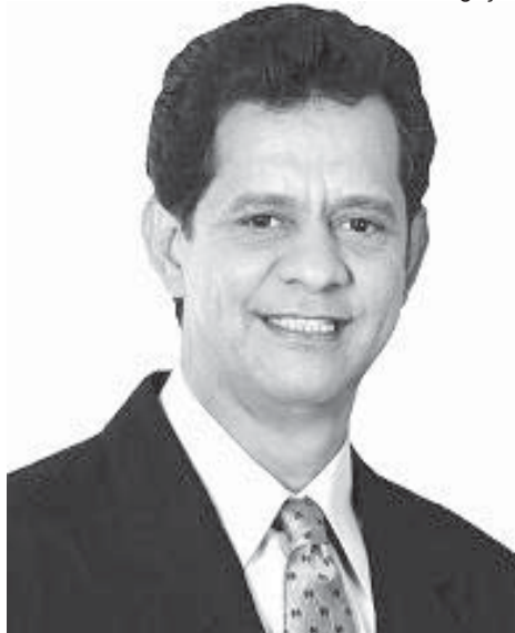
“Félix e seu governo são fracos e confusos”