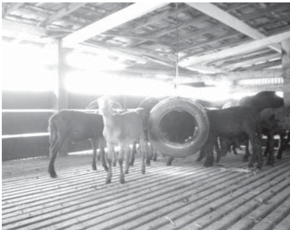
O caso de Limeira não foi o único; muitos relatos parecidos são contados pela Internet

Dezenas de casos semelhantes ao ocorrido em Limeira com os animais