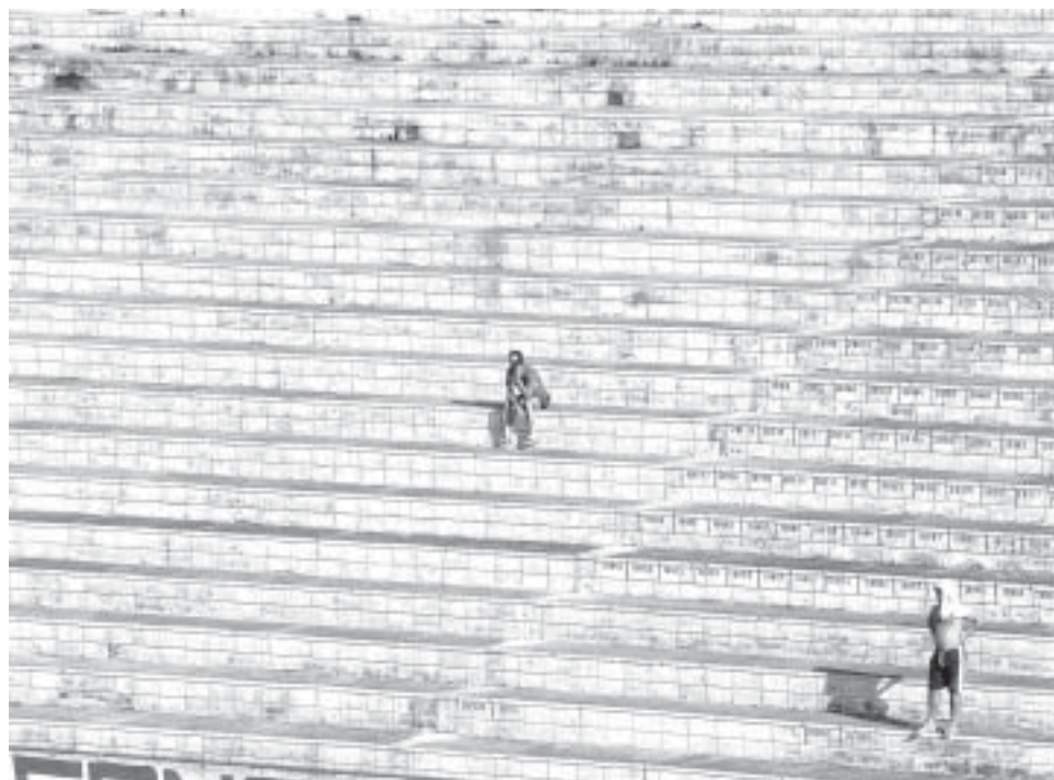
Estádio vazio, esse foi o retrato da Internacional, até o momento, neste ano de 2005

“O presidente da FPF cobrou algumas atitudes do prefeito, quando ele foi à sede da Federação”